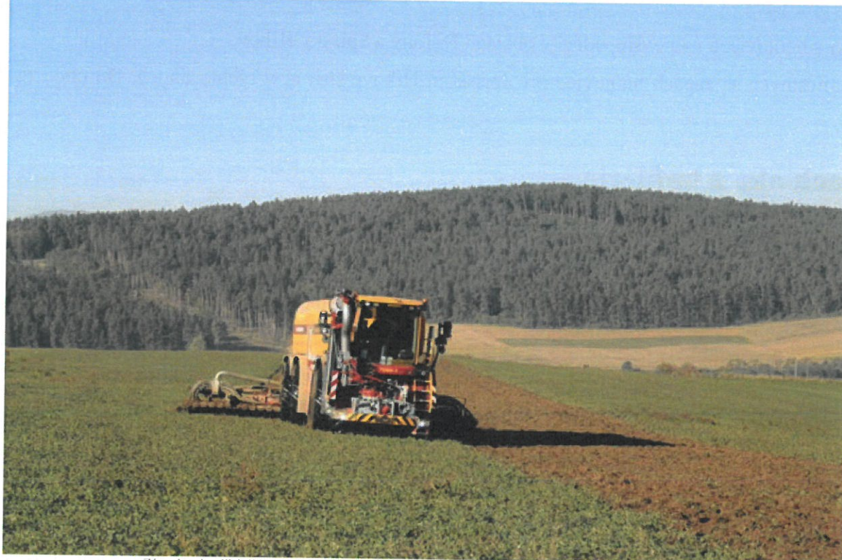
Zápach pri aplikácii hnojovice pri Levoči a v okolí Spišskom prekáža.