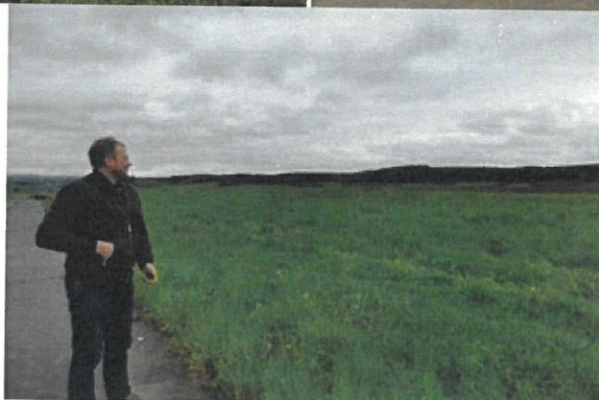
Zápach v okolí Levoče spôsobuje ľuďom problémy (6 fotografií)