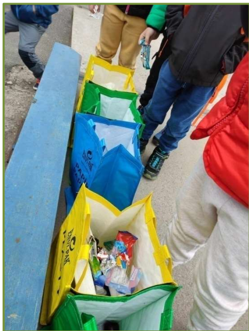
Foto z exkurzií Zberného dvora v roku 2023