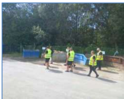
Foto z exkurzií Zberného dvora v roku 2022