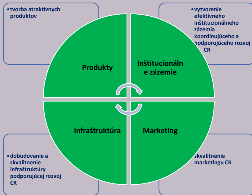
Obrázok 1 Určenie kľúčových disparít cestovného ruchu v okrese Levoča