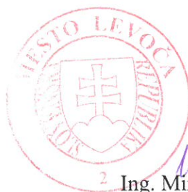
2 Ing. Miroslav Vilkovský, MBA primátor mesta

Toto rozhodnutie má povahu verejnej vyhlášky podľa § 26 zákona č. 71/1967 Zb. o správnom konaní v znení neskorších predpisov a musí byť vyvesené po dobu 15 dní na úradnej tabuli mesta Levoča a na webovom sídle mesta Levoča. Posledný deň tejto lehoty je dňom doručenia.